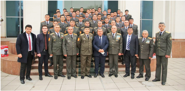
(Давоми. Боши 1-бетда.)

Тошкент тиббиёт академияси ҳузуридаги Ҳарбий-тиббиёт факультети курсантлари, бўлажак ҳарбий шифокорлар Ўзбекистон давлат санъат ва маданият институти талабалари томонидан ижро этилган бадиий-муסיқий чиқишлар, байрам табриги сифатида тақдим этилган куй-кўшиқ, дилбар рақс ва театрлаштирилган сахна асарларини мароқ билан томоша қилдилар.